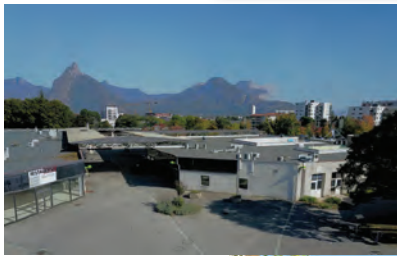
Vue depuis L'ilyade