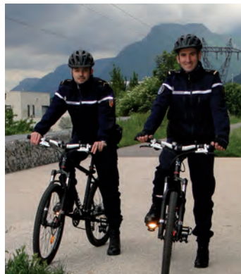
Depuis début mai, la brigade de gendarmerie de Seyssinet-Pariset a mis en place une patrouille à VTT. Objectif : lutter plus efficacement contre les cambriolages et renforcer la prévention de proximité.