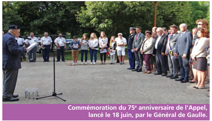
Commémoration du 75 e anniversaire de l'Appel, lancé le 18 juin, par le Général de Gaulle.