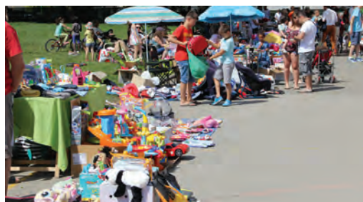
Nouveau succès pour la 2 e brocante des enfants, organisée par le Sou des écoles.