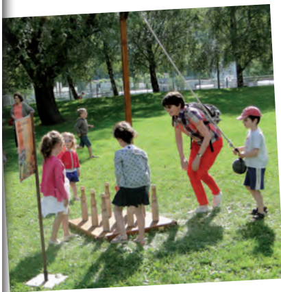
Fête de l'enfance/jeunesse