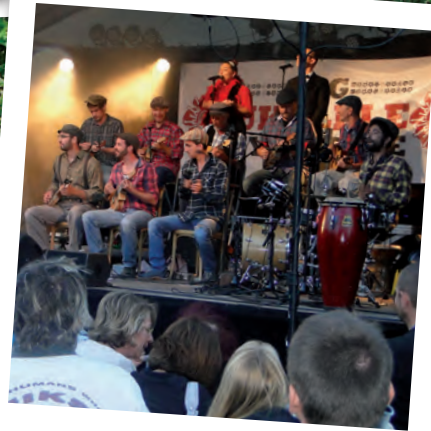
The Big Ukulélé Syndicate