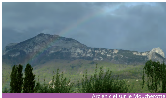
Arc en ciel sur le Moucherotte

Merci à Catherien Romand pour cette belle photo. Vous aussi, envoyez à communication@seyssinet-pariset.fr, vos meilleurs clichés pris sur Seyssinet-Pariset (qualité impression), en précisant vos coordonnées. Nous nous réservons le droit de publier ou non les photos envoyées.