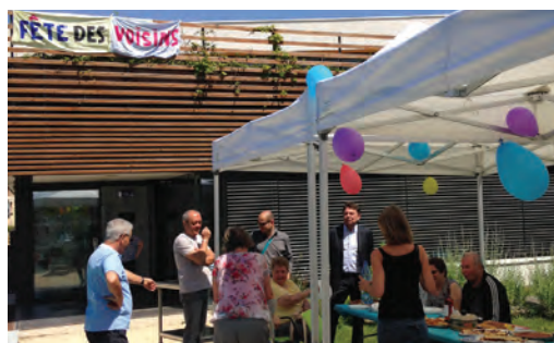
1 ère édition de la fête des voisins à l'Arche.