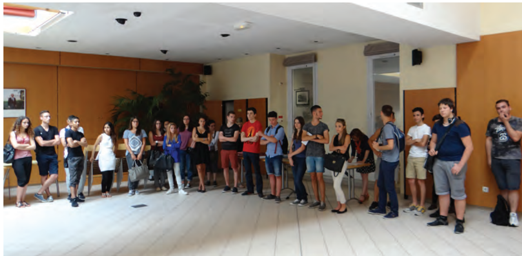
Agés de 16 à 22 ans, 30 jeunes Seyssinettois vont apporter cet été leurs concours auprès de différents services de la ville.