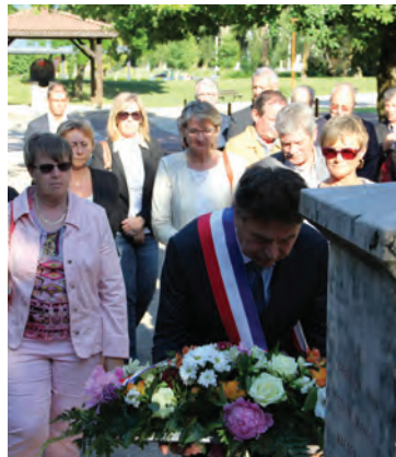
Le 27 mai dernier, la commémoration de la création du Conseil national de la résistance (CNR), initiée par J.Moulin.