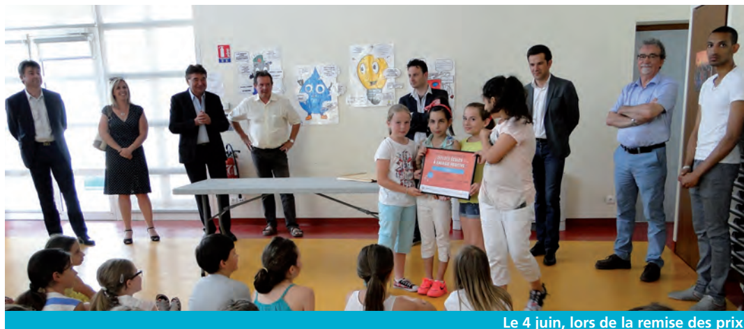
Le 4 juin, lors de la remise des prix

Après l'école Chamrousse l'année dernière, 4 classes de l'école élémentaire Moucherotte de CE2, CM1 et CM2 ont relevé le défi lancé par la Métropole afin de réduire la consommation d'énergie de leur école.