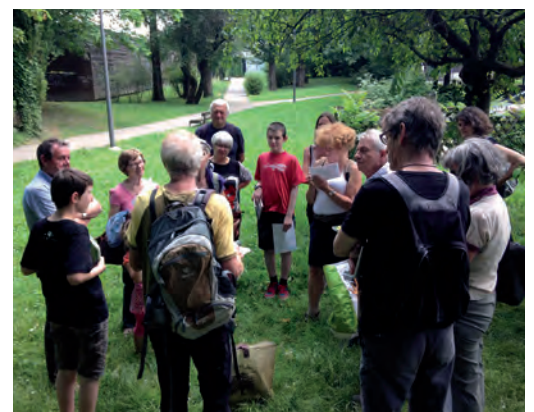
Rando, vélo et expo... Durant la semaine du développement durable, une dizaine d'animations à laquelle ont participé plus d'une cinquantaine de personnes, invitaient chacun à s'orienter vers un mode de vie plus responsable et plus respectueux de l'environnement.