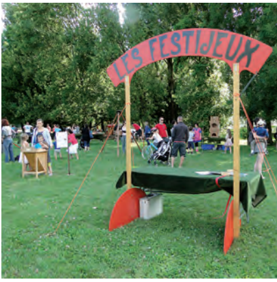
Fête de l'enfance/jeunesse