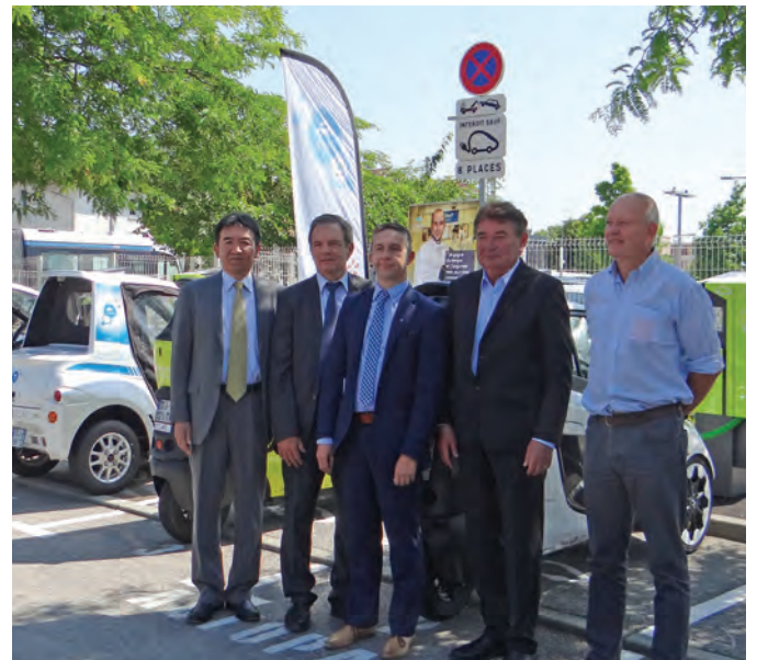
Dans le cadre de la journée de la mobilité douce, le 4 juin était inaugurée la station Citélib.