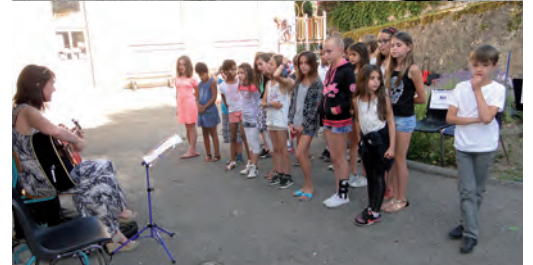
Fête du village, de belles prouesses de théâtre et de chants avec des petits chaperons rouges effrontés.