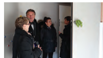
Les travaux dans les nouveaux locaux du service petite enfance et de la crèche familiale.

La présence forte du monde associatif est une chance pour la commune. A Seyssinet-Pariset, les associations savent parfaitement les efforts mis en œuvre depuis de nombreuses années, qu'il s'agisse des équipements dédiés ou mis à disposition mais aussi des moyens matériels et bien sur des subventions de fonctionnement et de la prise en charge des transports pour les compétitions. La mise en œuvre de toutes ces activités est naturellement une chance pour la ville, son animation mais aussi et surtout la qualité du lien social noué avec chaque adhérent. Dés