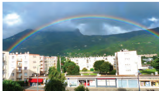
L'arc en ciel du 19 juin a eu un succès fou !

Nous nous réservons le droit de publier ou non les photos envoyées.