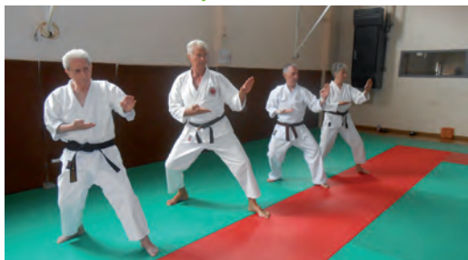
Le groupe des gradés perfectionnant une technique de parade.

..... Renseignements. Tél. 06 08 17 81 42 www.karate-seyssinet.fr