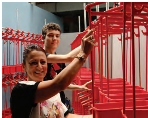
Premiers pas dans le monde du travail, premières expériences professionnelles, un moyen de gagner un peu d'argent... Durant l'été, la ville a employé 30 jeunes Seyssinettois, âgés de 16 à 21 ans dans différents services tels que l'entretien des espaces publics et des bâtiments, la restauration, à la ludothèque, à la bibliothèque, ou encore à la piscine.