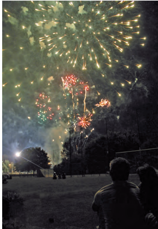
Un ciel seyssinettois "effervescent" et coloré le 13 juillet qui a séduit de nombreux spectateurs.