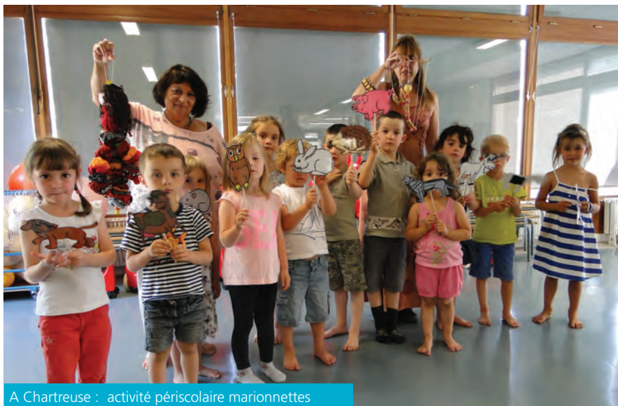
A Chartreuse : activité périscolaire marionnettes