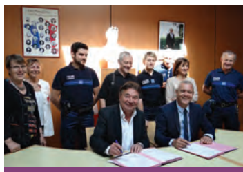
En mai, la signature de la convention entre les polices municipales de Seyssins et Seyssinet-Pariset