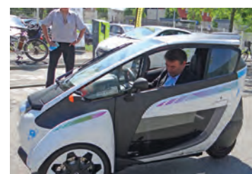
Lors de l'inauguration de Citilib