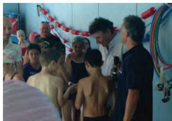
Lors de la fête du sport scolaire