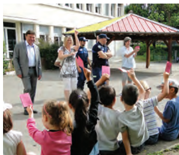
Remise des permis de rouler aux enfants de la maternelle Vercors