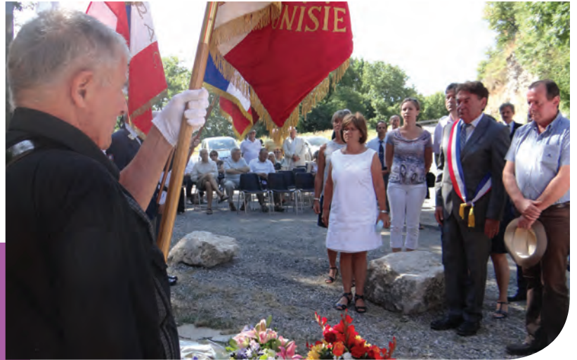
Le 21 juillet, hommage aux dix résistants, abattus par l'armée allemande, il y a 71 ans, au désert de l'Ecureuil.