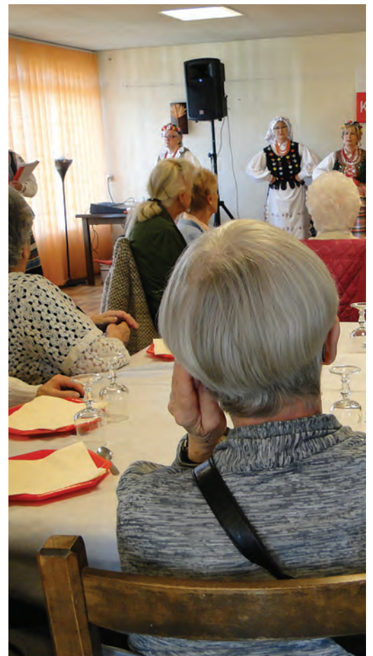
En mars dernier, lors d'un spectacle de danse folklorique à la résidence

Vous trouverez le programme détaillé auprès du service personnes âgées de la ville ainsi que sur la gazette du mois d'octobre, ainsi que sur le site internet de la ville.