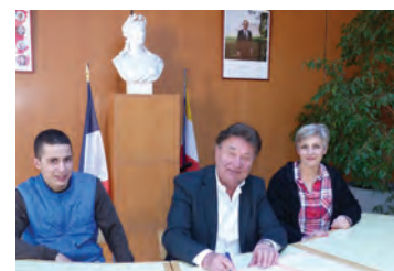
Signature de la convention pour la distribution alimentaire.