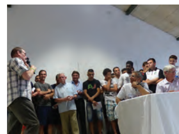
Les récompenses de l'Office municipal du sport associatif (OMSA)