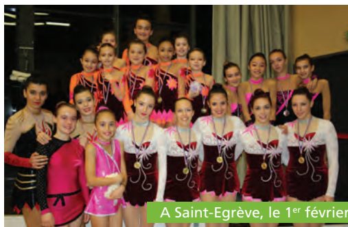
A Saint-Egrève, le 1 er février