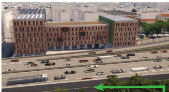
vue 3D, depuis les immeubles de Seyssinet-Pariset au bord du Drac, des écrans acoustiques en gabions