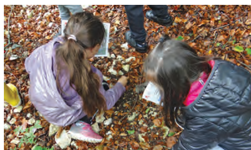
Lors du jeu de piste, les enfants (sur nos photos : les CE1 CE2 de l'école Moucherotte) ont dû ouvrir leurs yeux et leurs oreilles pour retrouver l'intrus qui a volé les noisettes de l'écureuil.