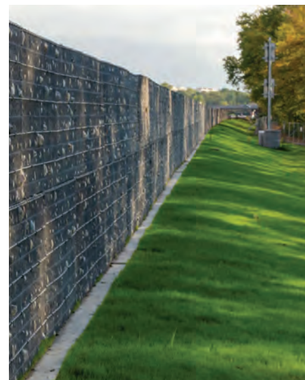
Vue 3D, en immersion sur l'autoroute, écrans acoustiques en gabions

En plus de leur fonction esthétique, ces écrans diminueront les nuisances sonores pour les riverains. Ils sont de normes A3 et permettront une réduction du bruit de l'ordre de 8 à 11 dB(A). Un gain non négligeable puisqu'en matière acoustique, une réduction de seulement 3 dB(A) correspond déjà à une division par deux du niveau sonore !