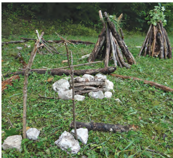
En construisant un village de lutins ou en participant au jeu de piste dans la forêt située au-dessus du centre Jean Moulin-Arnaud Beltrame, les enfants sont invités à s'intéresser à la nature qui les entoure. Du paysage aux traces d'animaux laissés dans le sol.