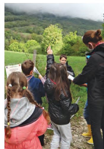
Pas de problème en revanche pour repérer ce qui peut entraver les déplacements de l'aigle ou du chevreuil.